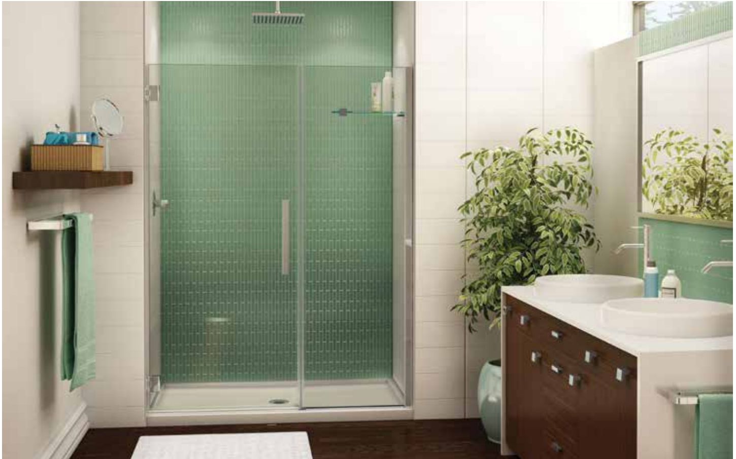
Model shown / Modèle présenté : PGKP57-11-40L-MD-79

Door and fixed panel - wall-mount hinges / Porte et panneau fixe - charnières fixées au mur