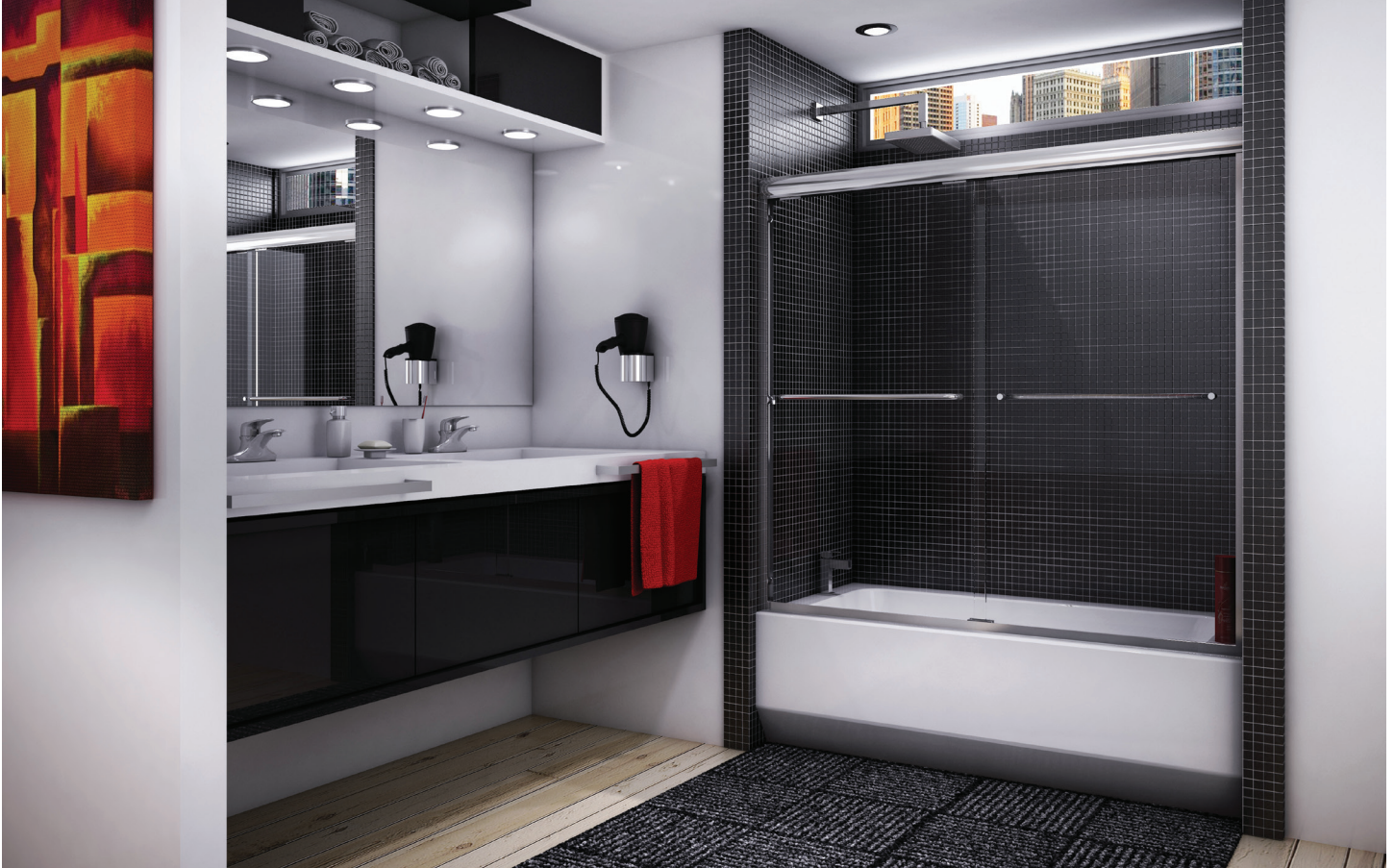
Model shown / Modèle présenté : CT860-11-40

Semi-frameless in-line sliding tub doors / Portes de baignoire coulissantes avec cadre partiel