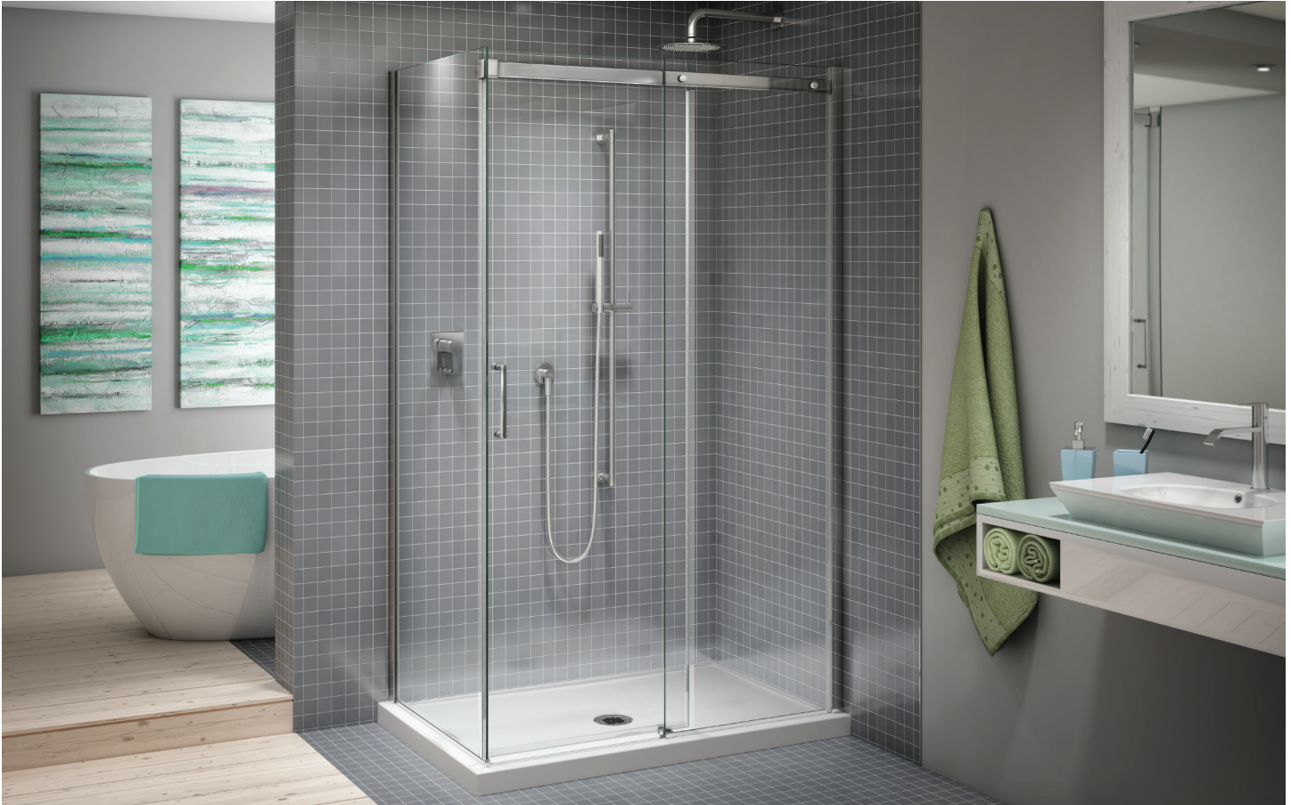
Model shown / Modèle présenté : NAP4836-11-40

Sliding door and fixed panel with return panel / Porte coulissante et panneau fixe avec panneau de retour