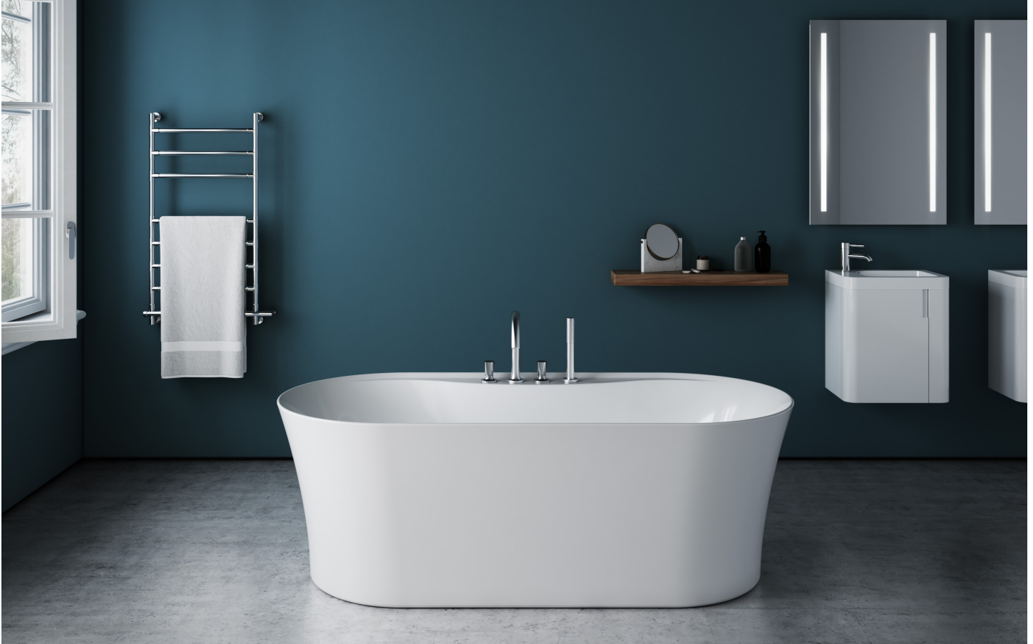
Model shown / Modèle présenté : Alto (BAL6731-18-11)